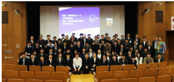
発表会参加者集合写真

物質・情報卓越コースおよび物質・情報卓越教育課程では、12月9日および12月10日に、成果発表会・中間発表会を大岡山キャンパス デジタル多目的ホールで開催しました。この発表会には、物質・情報卓越コースおよび物質・情報卓越教育課程に登録する学生が参加し、物質・情報卓越コースの学生は中間発表会として、物質・情報卓越教育課程の学生は成果発表会として研究成果を発表する場となりました。開催形式は対面とZoomを併用したハイブリッド形式で、本コースの連携協力機関である企業関係者や本コースの担当教員、物質・情報卓越教育課程のプログラム担当教員、学生など、学内外から約130名が参加しました。