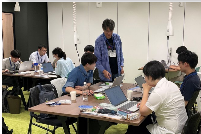
2025年度プラクティススクール実施風景

本プログラムの「物質・情報プラクティススクール」が、日本工学教育協会「工学教育賞(文部科学大臣賞)」を受賞しました。