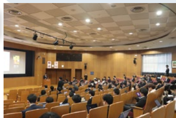
デジタル多目的ホールでの発表会

第2部では、物質・情報卓越教育課程の博士後期課程2年の学生が自主設定論文に関する進捗の発表を英語で行いました。自主設定論文は、自らの博士論文研究とは異なる課題を自主的に設定して研究します。自ら設定した課題に対し、専門分野の枠を超え、物質と情報を用いた複素的な新しい考え方を持つ独創的な研究を自立的に行う能力を身につけることが目的です。教育課程の登録学生は、博士後期課程2年の6月か12月の成果発表会にて、英語で研究の進捗状況を発表した上で、博士後期課程修了時まで、実施した研究結果を論文にまとめます。今回は今年度発表を行う予定の博士後期課程2年生のうち22名が発表を行いました。