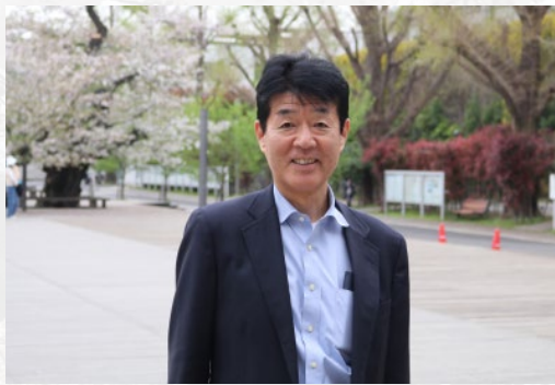
物質・情報卓越コース コース主任 物質・情報卓越教育課程 プログラム主査 総合研究院 教授