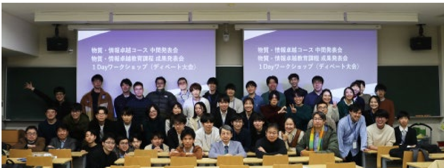
ディベート大会終了後の集合写真

学生たちは、技術的課題に対する多角的な視点を養うとともに、異なる立場から議論することで、より深い理解と柔軟な思考力を身につける貴重な機会となりました。また、D1・D2混成チームによる活動は、学年間の交流を促進し、先輩・後輩間のつながりを強化する有意義な場となりました。