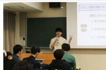
主張を力強く届ける学生たち