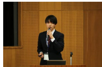
D2学生による自主設定論文進捗発表