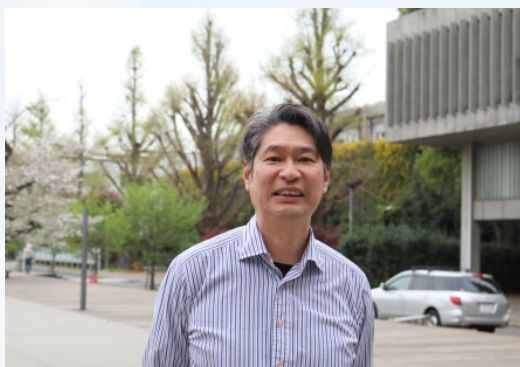
物質理工学院 物質・情報卓越コース担当 マネジメント教授