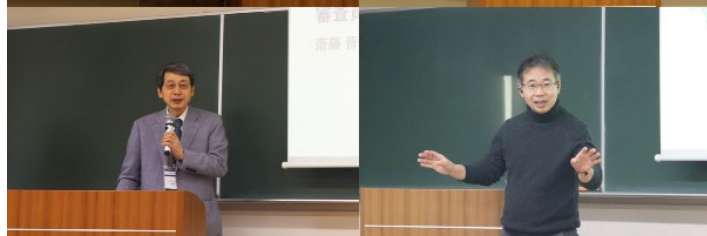
審査員の先生方からの講評

午前・午後のセッション終了後には、各会場で講評と結果発表が行われ、最後にチームごとの振り返りと記念撮影を実施しました。