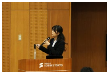
D1学生による発表の様子