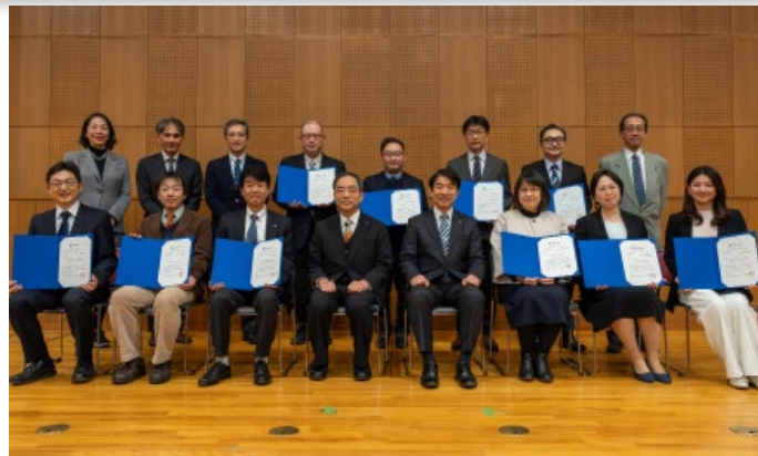
東京科学大学デジタル多目的ホールで行われた授賞式

業績 物質・情報卓越教育院における「複素人材」育成を通じた産学協創博士教育の確立