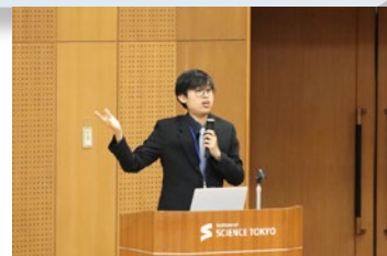
D1学生による発表の様子