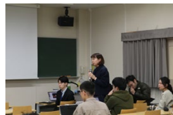
ディベート大会で議論を交わす学生チーム