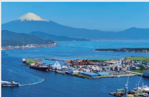
日本軽金属株式会社 清水工場

1939年、古河電気工業(株)と東京電燈(株)(後の東京電力ホールディングス(株))の提携により、日本軽金属(株)はアルミ製錬会社として誕生しました。戦後の復興期から高度経済成長期にかけて、アルミニウム需要の拡大を背景に事業基盤を確立しましたが、1970年代の二度にわたるオイルショックを受け、エネルギーコスト高騰という構造的課題に直面しました。これを契機に、製錬依存からの脱却を進め、圧延や加工分野を含む総合一貫体制への転換を図ってきました。